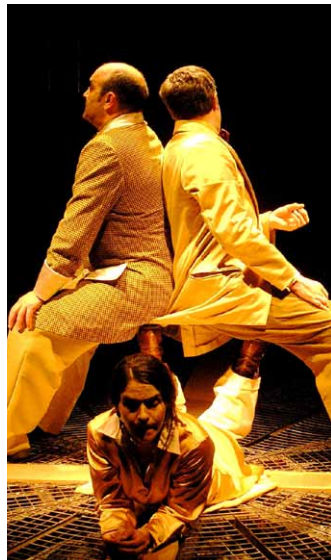
Cie La Tribouille - latribouille.free.fr