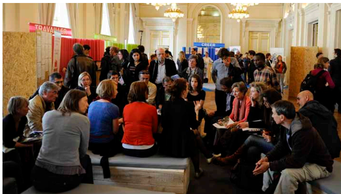
Une scénographie originale présentait du mobilier respectueux de l'environnement.

En partenariat avec : Adie, Afev, Avise, l'Atelier, Les Cigales, Coopérer pour Entreprendre, Couveuse Epicéas, Ecole de l'entreprenariat en économie sociale (EEES), La Fabrique à Initiatives Ile de France, France Active, France Bénévolat, Passerelles et Compétences, Ressources Solidaire, La Ruche, Unis-Cité.